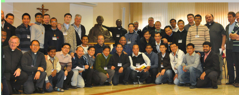
Participantes en el primer encuentro de misioneros salesianos en Europa, en Pisana, 25-27 nov. 2011

Todo esto debería ayudar a los Salesianos que trabajan en este contexto a lograr una mentalidad cada vez más europea, robustecer la sinergia entre las Inspectorías en los diversos sectores y reforzar la colaboración a nivel Regional». Entonces, ¿Qué puedo ofrecer por el Proyecto Europa?